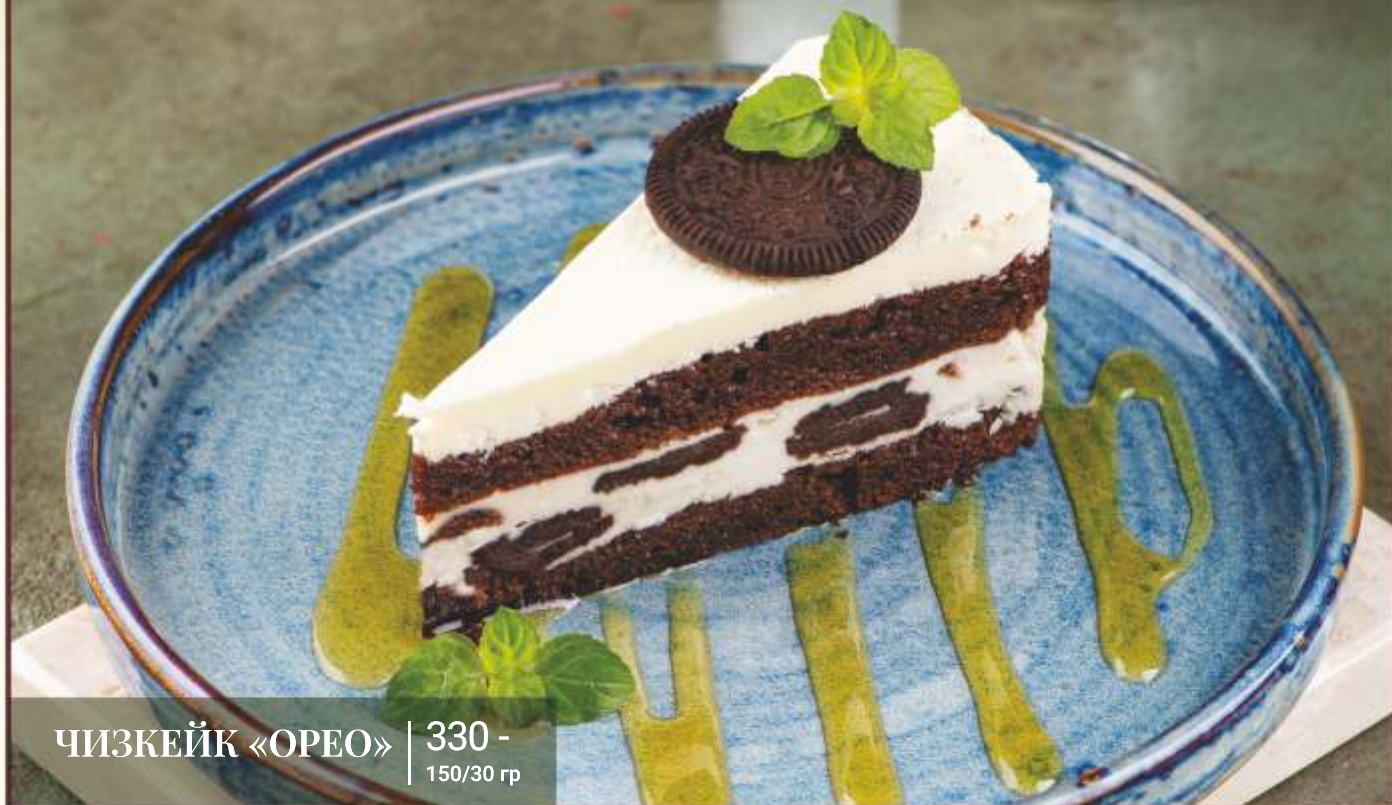
ЧИЗКЕЙК «ОРЕО» | 330 - 150/30 гр